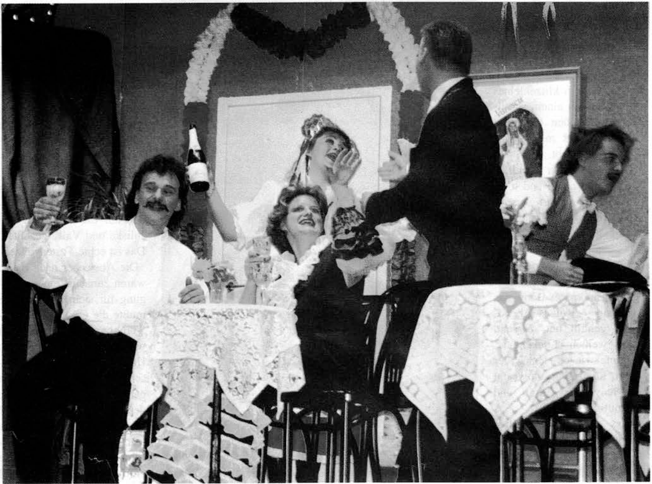
Das Orpheum in Budapest

für die "Mädels vom Chantant", seine Verirrung geht tiefer. Um Sylva von ihrer Reise in die Neue Welt abzuhalten, verspricht er ihr schriftlich die Ehe.