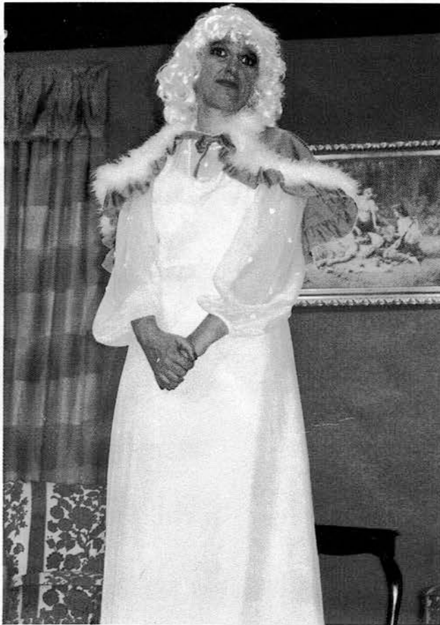
Traumpaar mit Verspätung: Stasi...